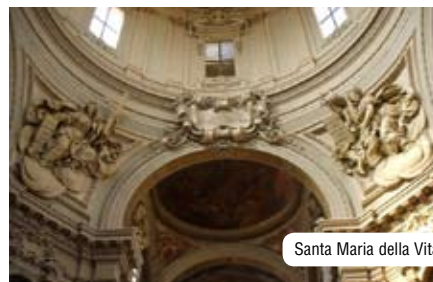
Santa Maria della Vita