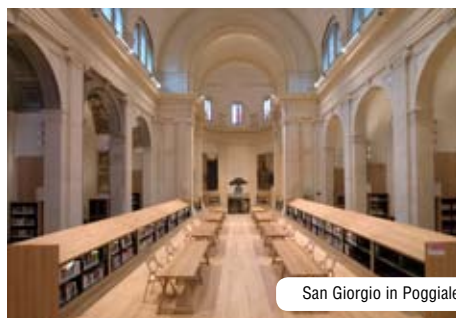
San Giorgio in Poggiale

Sperimentale e dinamico, il Museo della Città rappresenterà un collegamento ai musei tradizionali di Bologna e una chiave di lettura per conoscere la storia della città, interpretarne il presente e progettare il futuro.