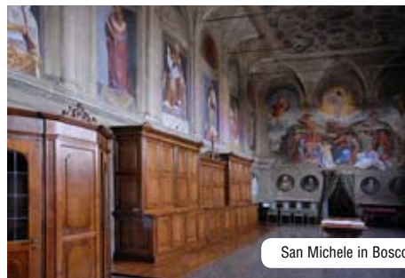
San Michele in Bosco