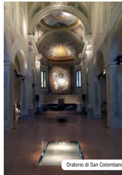
Oratorio di San Colombano